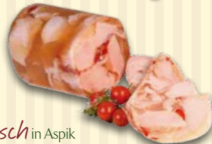
Hähnchenfleisch in Aspik (84401) aus zartem, magerem Hähnchenfl. Fettghst. 5%

(72101) aus magerem Schinkenfl. & Champignons. Fettghst. 5%