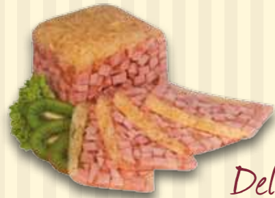
Del. Schinkenfleisch mit Zwiebeln (72201) aus magerem Schinkenfl. & Zwiebelringen. Fettghst. 5%